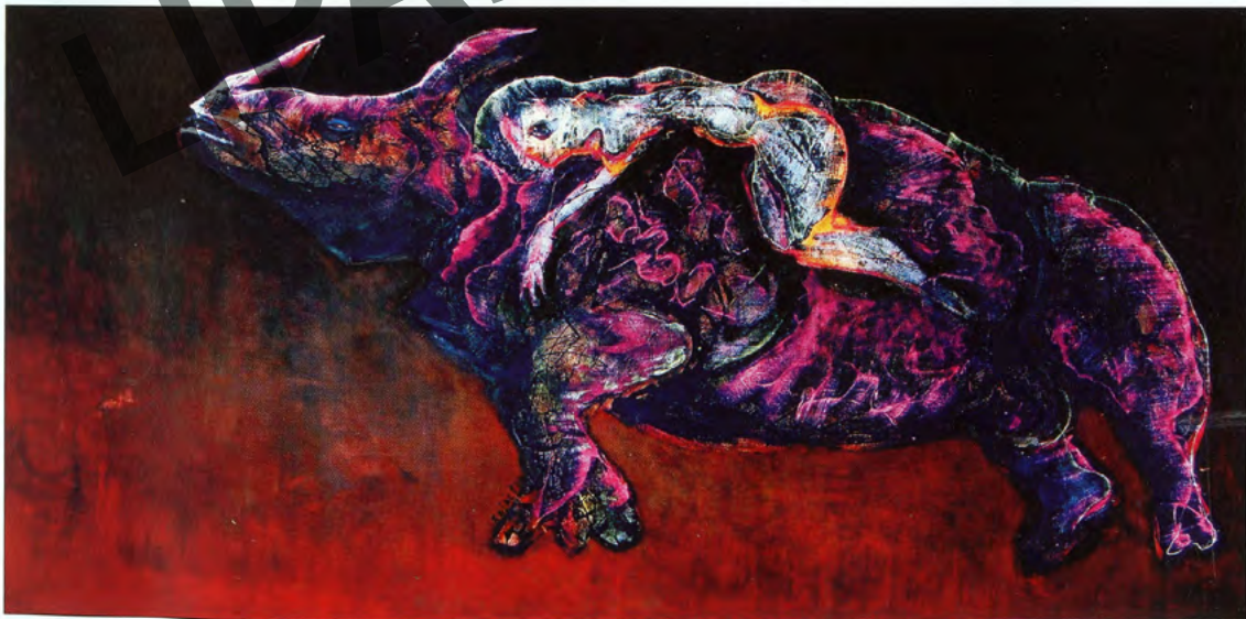
Abajo: Apasionata, 1994 Óleo sobre lienzo, 1.75 m x 1 m