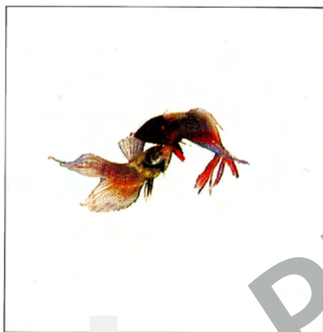
Titanes en el agua. 2006, Video Dimensiones variables