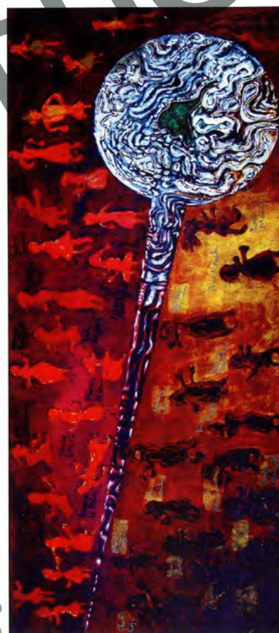
Tupus de Maria. 1997, óleo sobre lienzo 1.75 m x 0.75 m

La creación es posible solo en el perfectodesprendimiento de lo artificioso; de allí que existirá tanta pintura artificiosa como artificiales sean quienes la consuman, y el arte seguirá siendo tangible e inexplicable.