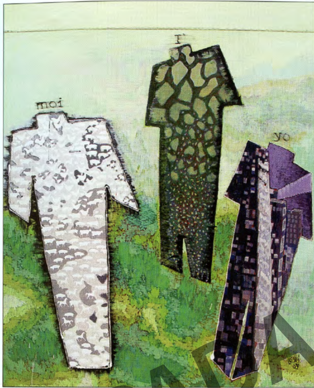
Izquierda: Sin título, 2000, Óleo sobre lienzo 1.50 m x 1.20 m