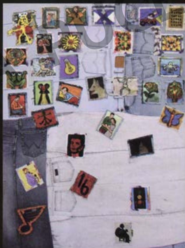
Lluvia. Mixta / Jean. 1.70 x 1.50 m.