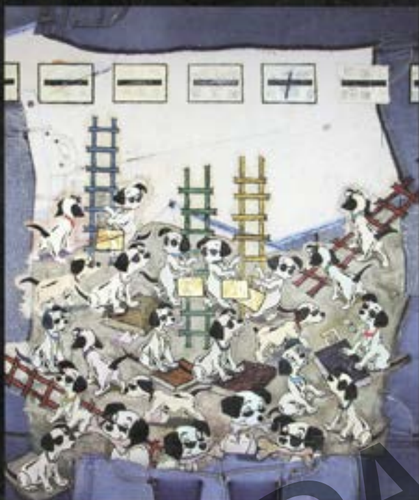
Tarde de perros. Mixta / Oleo Jean. 1.30 x 1.20 m.

De 1994 y 2006, participa en todos los salones nacionales de pintura, grabado y dibujo de Quito (Mariano Aguilera, El Comercio, Salón de Diciembre; Guayaquil (Salón de Julio, Salón de Octubre); Ambato (Salón Luis A. Martínez) y Roboramba. Realiza acciones e instalaciones en las calles, hospitales psiquiátricos, cines pornográficos y sitios de tolerancia de Bogotá, Quito y Lima, lugares donde el diálogo es más directo con el espectador. En 1997 participa en la octava Internacional de Liga Latinoamericana de Artistas en Santa Fe de Bogotá – Colombia. En 1998 es seleccionado para participar en la III Bienal de Lima en el Museo de la Nación. Entre 1999 y el 2008 expone colectivamente en Alemania (Heidelberg, Verano 2000); Malasia (The National Art Gallery Malaysia, Balai Seni Lukis Negara, Kuala Lumpur); República Dominicana (Museo de Arte Moderno de Santo Domingo); Bienal de Arte Latinoamericano del Bronx (New York-USA). Tiene menciones de honor en dibujo, pintura y grabado. En el 2005 gana el premio SONY Internacional de Fotografía categoría Arquitectura en Panamá. En 2007 gana el Premio Internacional de Fotografía Fotoclube I/508 Brasilia-Brasil. Individualmente expone fotografía y pintura con: Suburban 2006; Testimonia rock Quito 2007; bajoSITIO, Testimonia rock (USA) y Delconstruir 2008 (Perú).