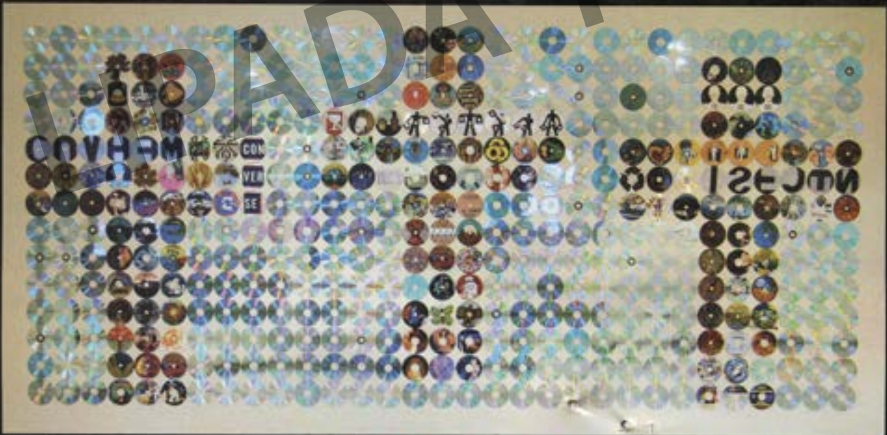
Gólgota. Mixta / Instalación. 4.00 x 2.00 m.