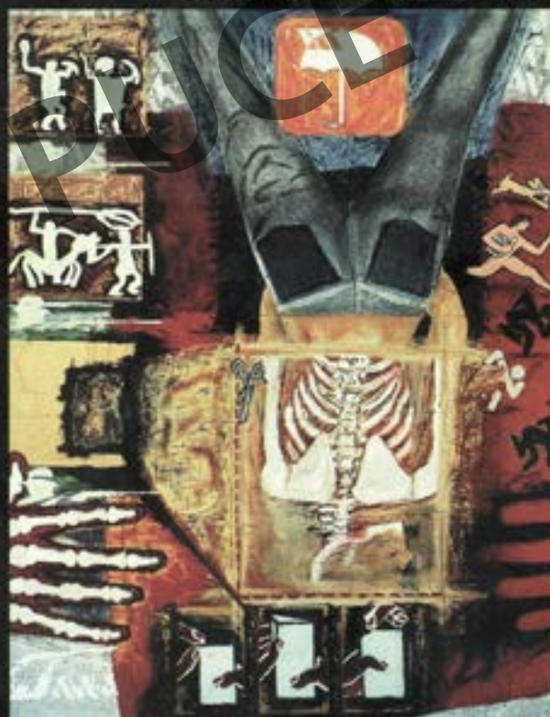
Fuga. Mixta / Oleo Jean. 1.70 x 1.50 m.