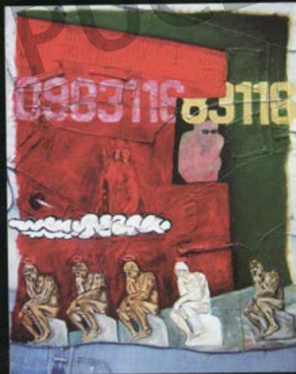
Tormenta. Acrílico / Jean. 1.50 x 1.20 m.

Su trayectoria artística empieza en 1991 con la AVANZADA apARTE, grupo que utiliza las calles para accionar el arte urbano, estas actividades en 1993 lo llevarían invitado a exponer en Colombia en la segunda exposición Internacional de la Liga Latinoamericana de Artistas. Establece contacto con el grupo Eclipse de Bogotá, con los cuales realiza y trabaja los Dramas Urbanos, base para el desarrollo de la propuesta entre Sincretismo y Para-Modernidad que años más tarde serviría para realizar su Tesis de Grado, consecutivamente en ese año, en Ecuador, organizan la tercera exposición Internacional de la Liga Latinoamericana de Artistas en Quito.