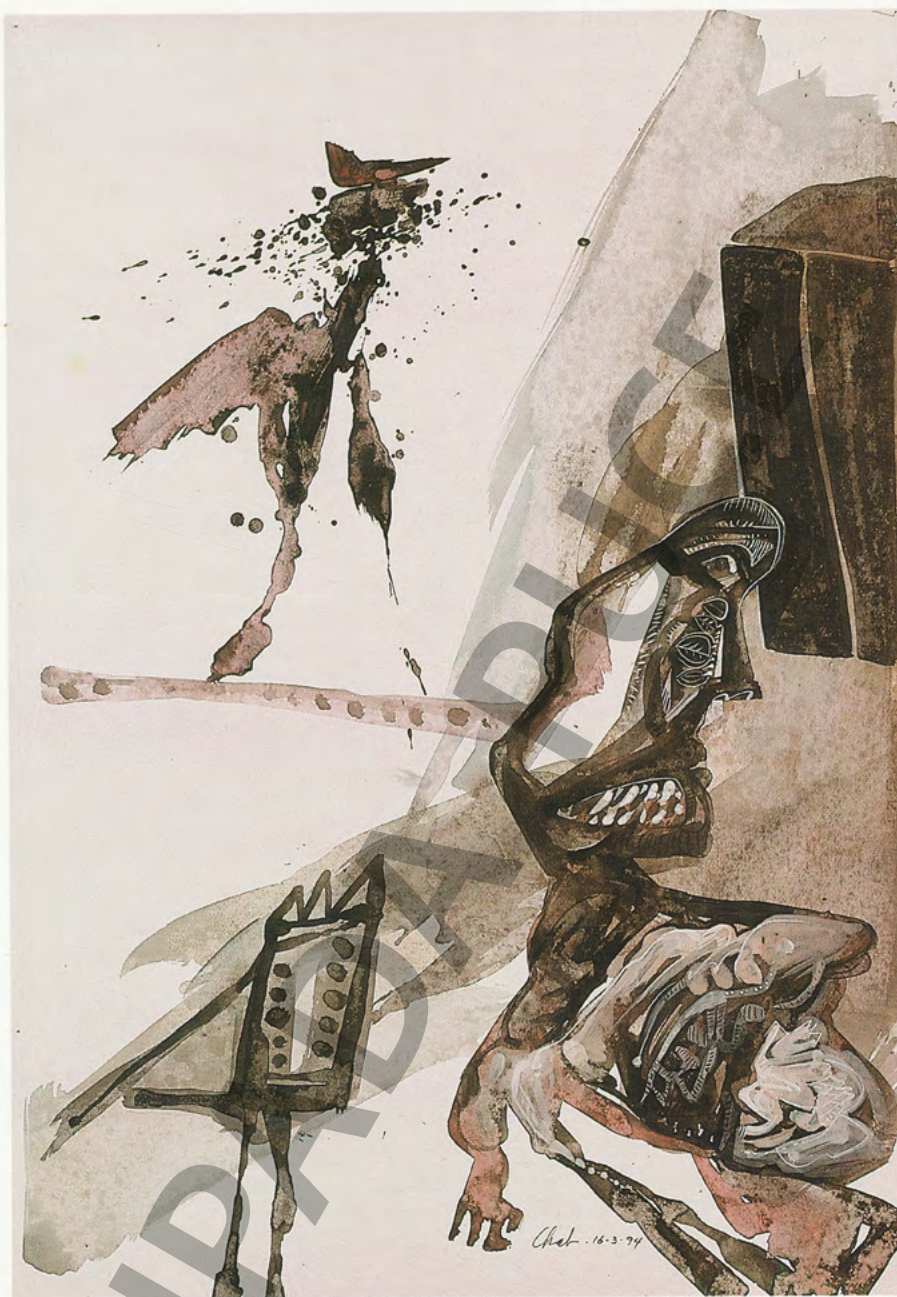
"suite del Canto cuarto", tinta, 100 x 70 cm, 1994.