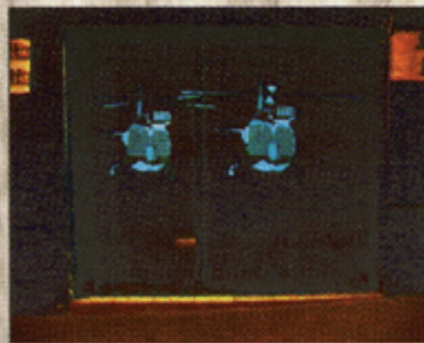
Imágenes exclusivas del momento en que los dos helicópteros despegan del Palacio de Gobierno con rumbo al Aer