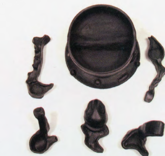
Paco Cuesta. Guayaquil, 1953 Vajilla para comer caldo de salchicha, objeto cerámico, siete piezas, años 80

Muestra itinerante de obras, fotografías y documentos que intentan ofrecer una mirada sobre el quehacer artístico de este grupo guayaquileño.