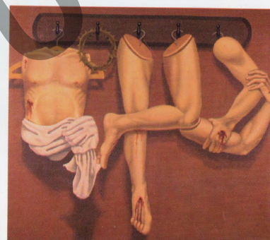
Marcos Restrepo. Catarama, 1960 El cuerpo de Cristo, óleo sobre tela, 80x90 cm. 1985